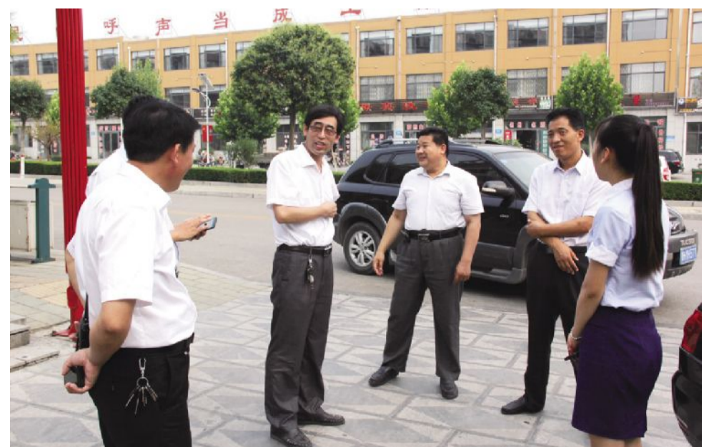
7月9日，农村环境综合整治验收组领导莅临指导。