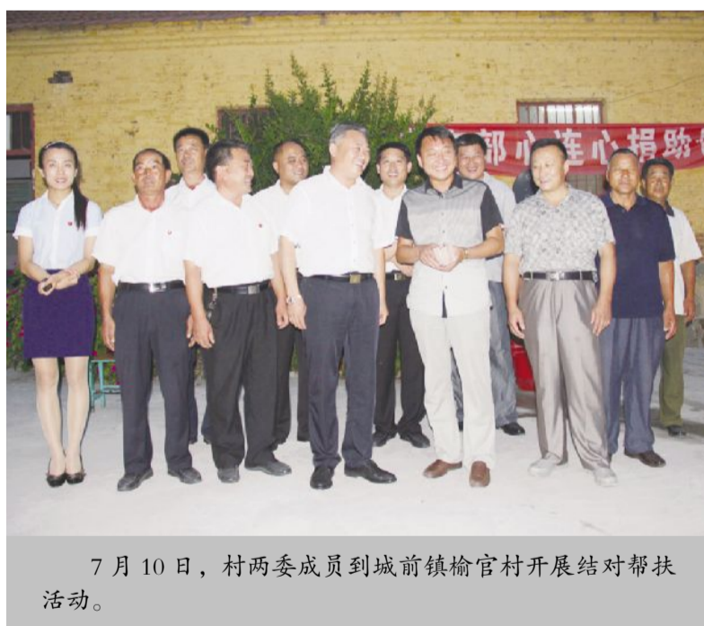
7月10日，村两委成员到城前镇榆官村开展结对帮扶活动。