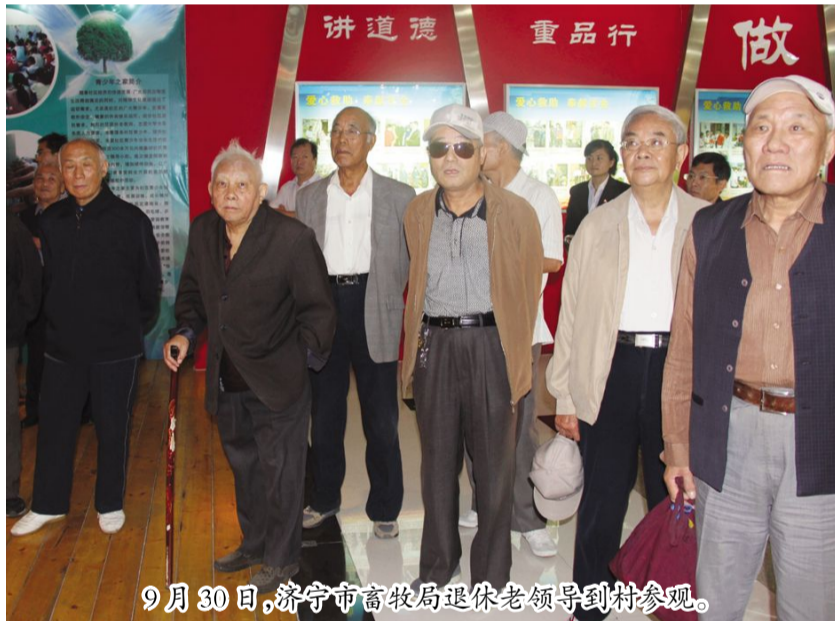
9月30日，济宁市畜牧局退休老领导到村参观。