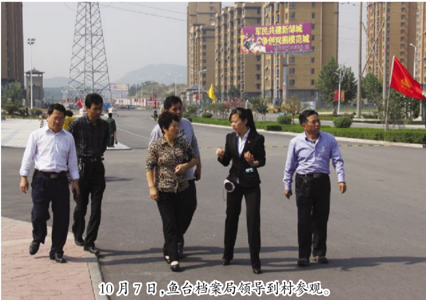
10月7日，鱼台档案局领导到村参观。