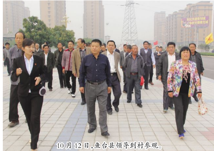
10月12日，鱼台县领导到村参观。