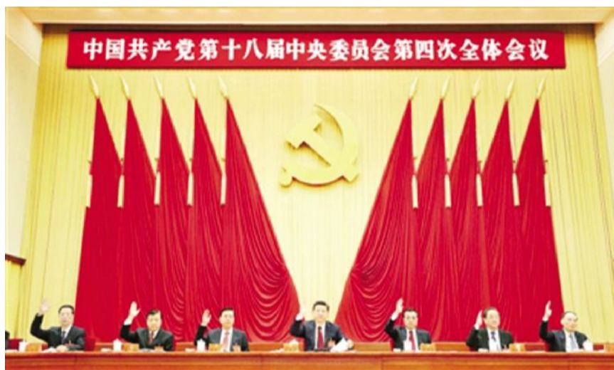
中国共产党第十八届中央委员会第四次全体会议，于二〇一四年十月二十日至二十三日在北京举行。这是习近平、李克强、张德江、俞正声、刘云山、王岐山、张高丽在主席台上。

全会听取和讨论了习近平受中央政治局委托作的工作报告 全会审议通过了《中共中央关于全面推进依法治国若干重大问题的决定》 全会号召，全党同志和全国各族人民紧密团结在以习近平同志为总书记的党中央周围，高举中国特色社会主义伟大旗帜，积极投身全面推进依法治国伟大实践，开拓进取，扎实工作，为建设法治中国而奋斗