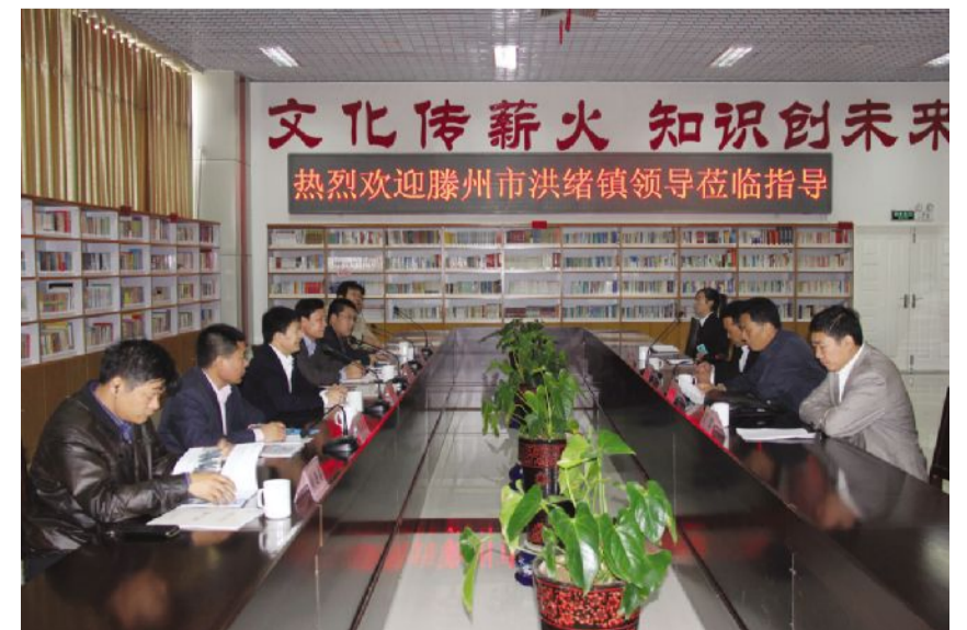
10月21日，滕州市洪绪镇领导莅临指导，并于展厅会议室召开新型农村社区建设工作座谈会。