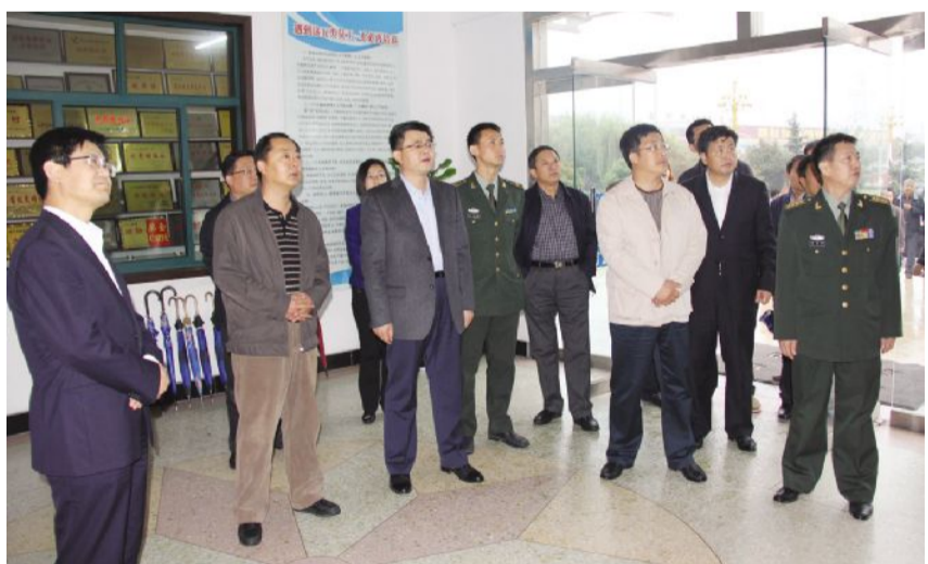
10月30日，省双拥模范城年度考核组第8组到我村检查双拥工作，济宁市副市长张继民，市委副书记朱瑞显陪同。