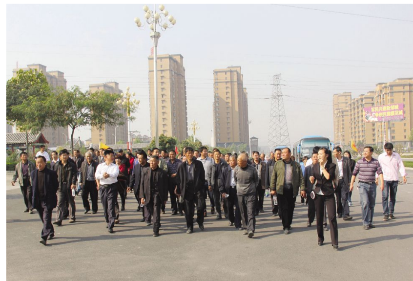
10月18日，太平镇参观团到我村参观学习。