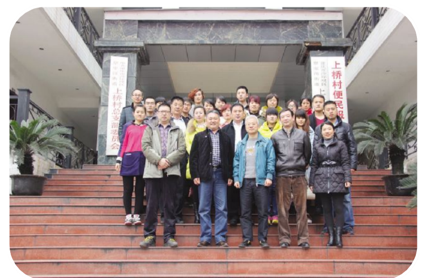
优秀员工到重庆沙坪坝区上桥村参观学习

为丰富员工文化生活，增强企业凝聚力，进一步激发员工的工作热情和动力，集团公司组织优秀员工及其孩子五十余人，到西安、广安、重庆等地方参观学习，先后到了秦始皇陵兵马俑、华清池、武侯祠、重庆大礼堂、开封府、清明上河园等著名景点，红岩博物馆、邓小平故里等红色教育景点，同时，到韩东村、牌坊村、上桥村等全国文明村参观学习，学习他们建设、发展的先进经验。