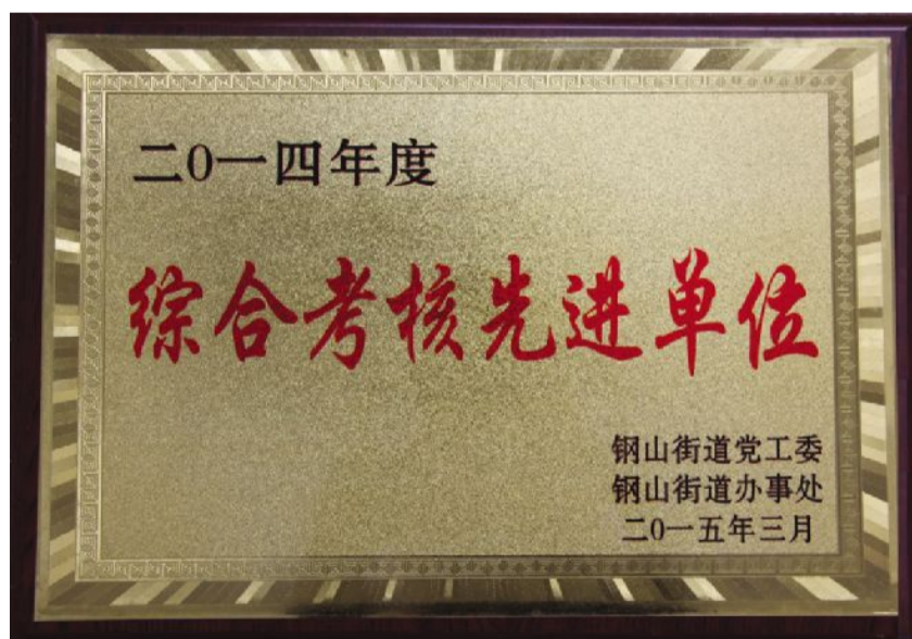
后八村荣获钢山街道2014年度综合考核先进单位，这是我村连续第九年荣获此荣誉。