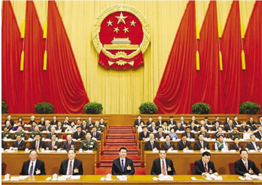
3月5日，第十二届全国人民代表大会第三次会议在北京人民大会堂开幕。党和国家领导人习近平、李克强、俞正声、刘云山、王岐山、张高丽等出席会议。

新华社北京3月5日电 第十二届全国人民代表大会第三次会议5日上午在人民大会堂开幕。国务院总理李克强向大会作政府工作报告时指出，时代赋予中国发展兴盛的历史机遇。我们要紧密团结在以习近平同志为总书记的党中央周围，高举中国特色社会主义伟大旗帜，凝神聚力，开拓创新，努力完成今年经济社会发展目标任务，为实现“两个一百年”奋斗目标、建成富强民主文明和谐的社会主义现代化国家、实现中华民族伟大复兴的中国梦作出新的更大贡献。