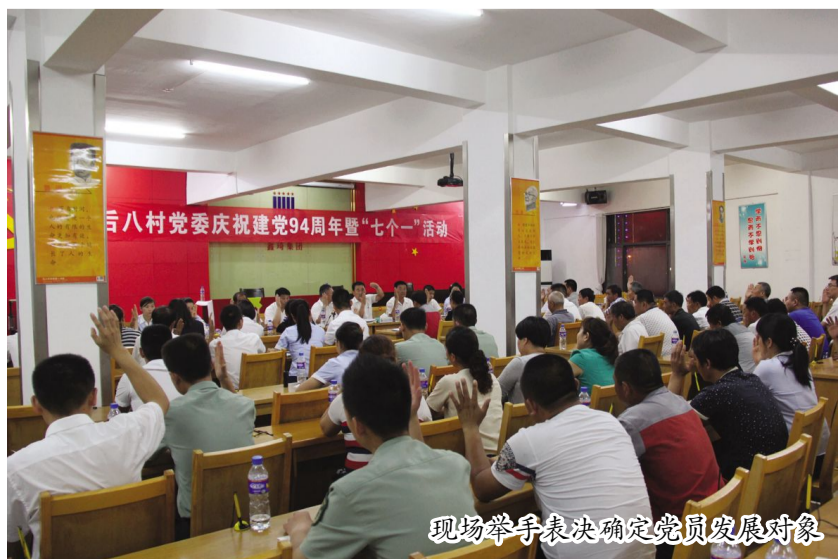
现场举手表决确定党员发展对象