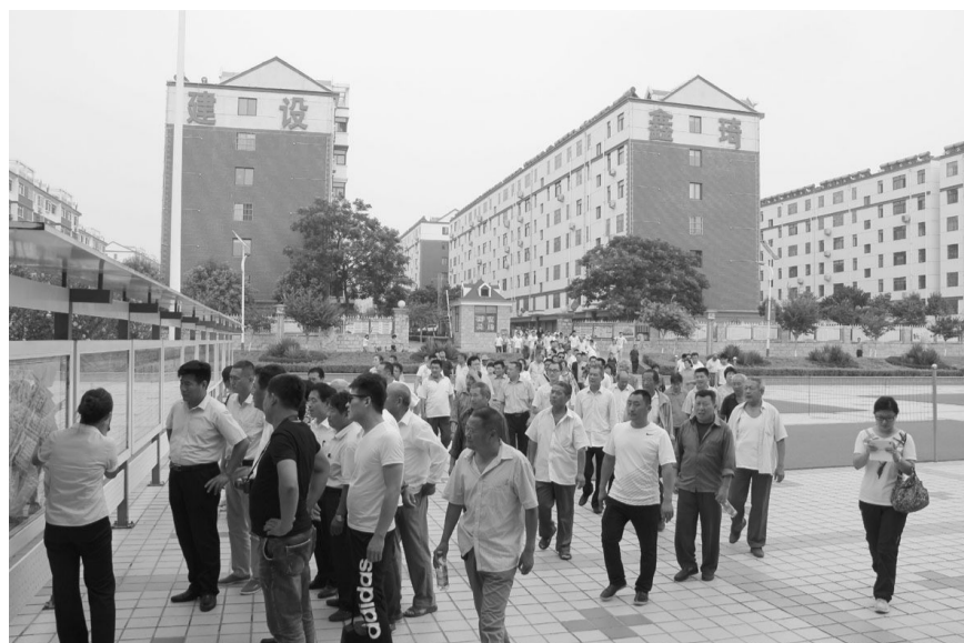
6月30日,兖州区新集镇部分党员200余人到村参观学习。