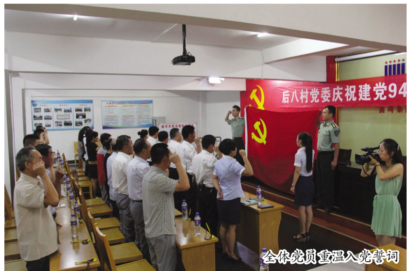
全体党员重温入党誓词