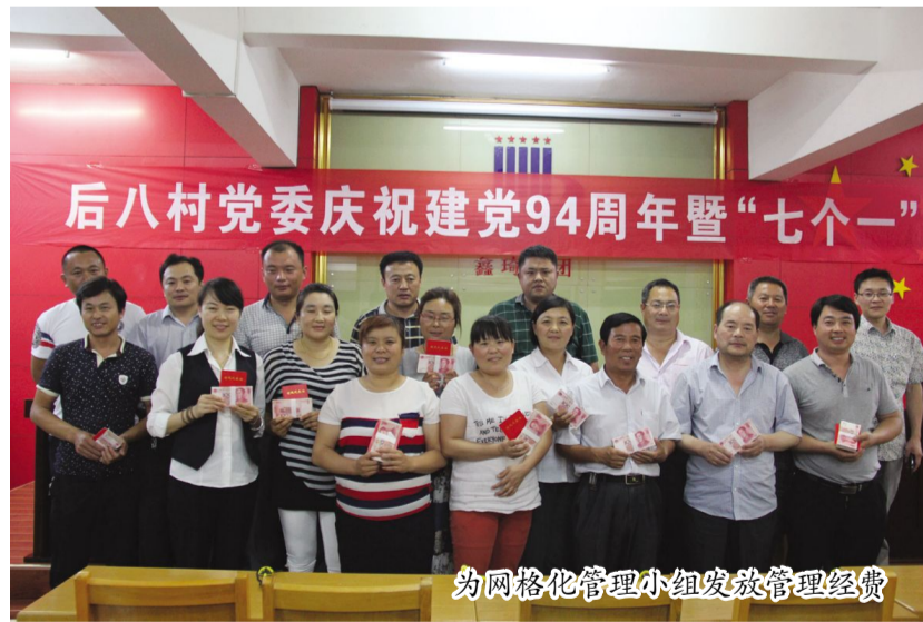
为网格化管理小组发放管理经费