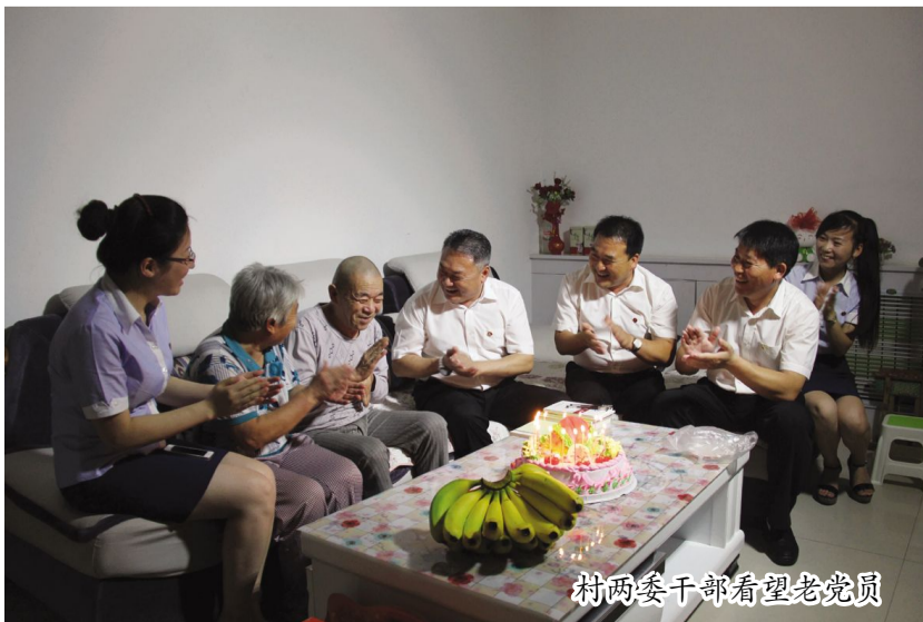
村两委干部看望老党员