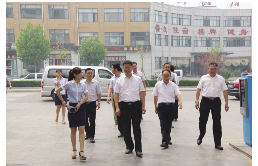
6月17日，济宁市任城区组织部领导莅临检查指导工作。