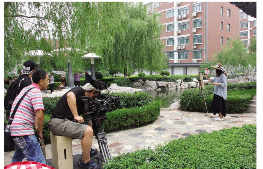
6月27日至29日，中国最美乡村摄制组来村拍摄《蜕变——中国文明乡村山东·邹城·后八村》公益视频。破茧成蝶——蜕变，蜕变就意味着突破、新生。后八村在短短五年时间就突破了一次大变，而十年的规划目标更是一次极限超越的巨变。此公益视频将选送中央电视台等国内外各大电视台、网站视频播。