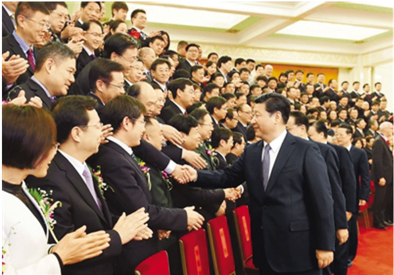
1月8日,2015年度国家科学技术奖励大会在北京人民大会堂隆重举行。会前,习近平、李克强、刘云山、张高丽等党和国家领导人会见获奖代表。