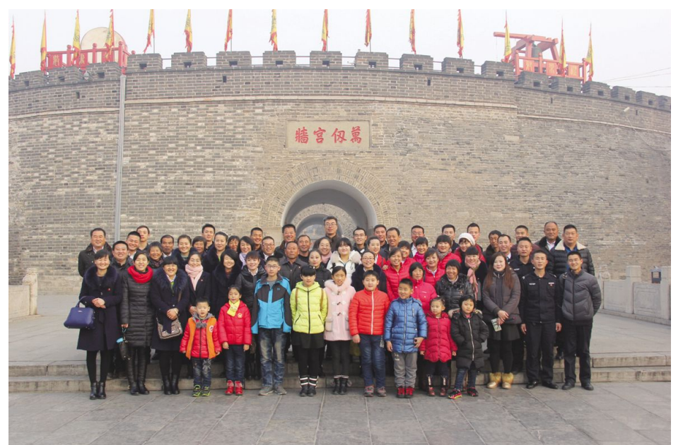
1月3日,集团公司组织部分员工及员工孩子去曲阜“修习儒家文化,感悟儒学精华”。