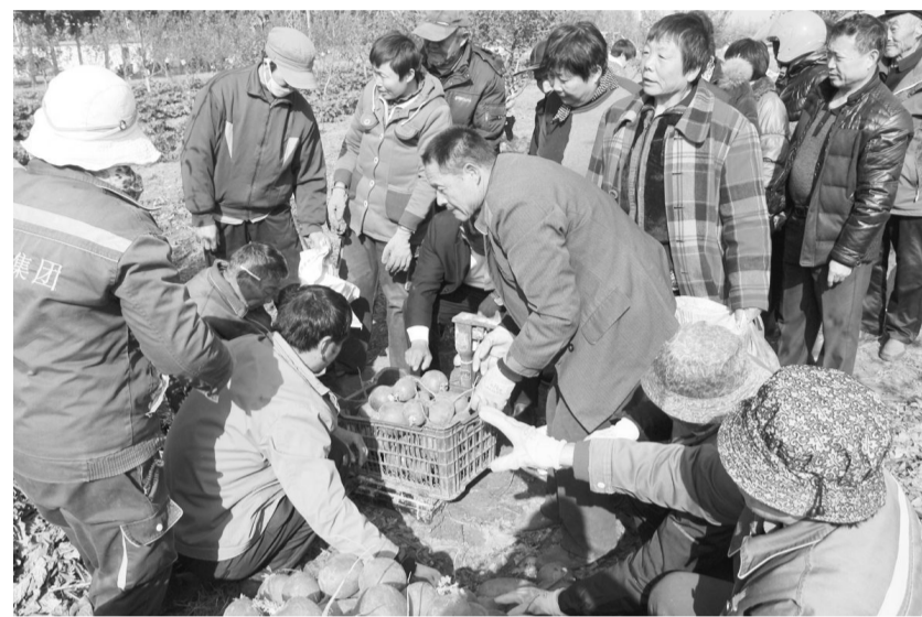
果园萝卜丰收，11 月 11 号免费为村民发放萝卜。