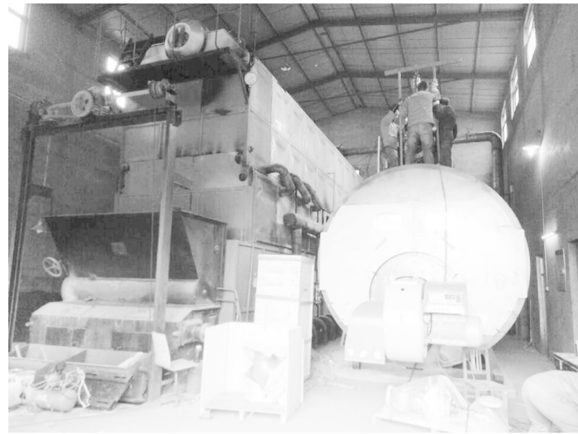
为响应市政府号召，保护环境，村两委投资采购燃气锅炉为居民供暖，目前工人正在施工中。

2014 年 5 月 22 日，美国纽约。湿冷的天气掩不住时代广场上热烈和喜庆的气氛。纳斯达克迎来了第 118 个 IPO——京东集团，这也是目前中国公司赴美上市最大的一单 IPO。这天早晨，一个穿着紫红色的上衣，戴着珍珠项链的身影，在一群黑西装中显得格外出挑。这就是京东的第一位投资人——徐新。上市当日，京东收盘价为 20.90 美元，较发行价上涨 10%，市值达 286 亿美元。今日资本持有京东 7.8% 的股份，按此计算，徐新在京东上市中大赚了 22 亿美元。截止 2014 年 7 月底，京东股价涨至 400 亿美金，算上减持部分，今日资本赚了近 30 亿美元。