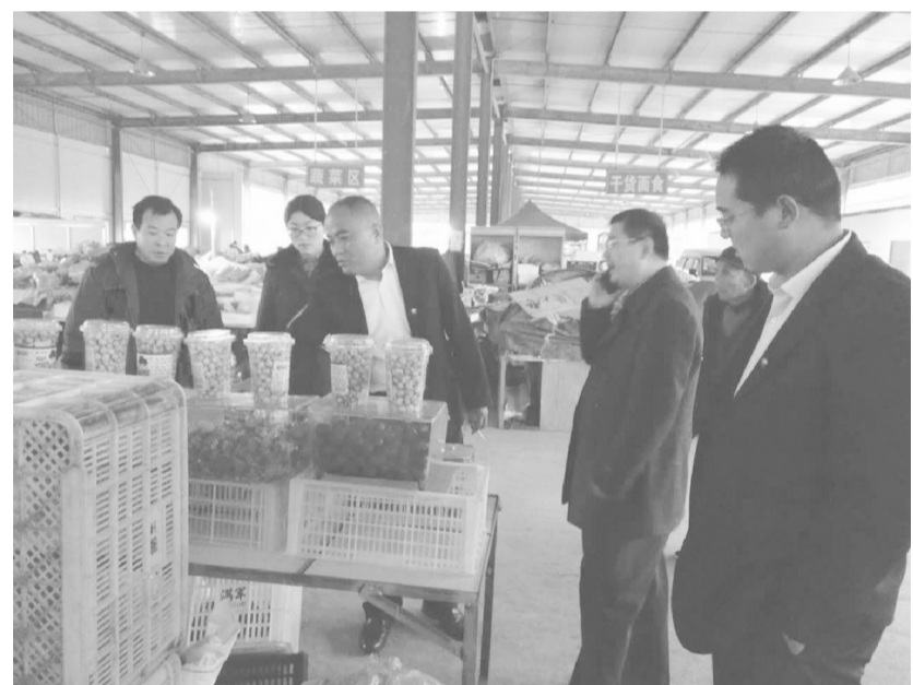
为提高鑫琦市场食品安全质量，创建食品安全先进市，让消费者能够买的放心，吃的舒心，食药局徐局长特来我鑫琦市场指导工作。图为市场工作人员陪同食药局领导在检查指导工作。