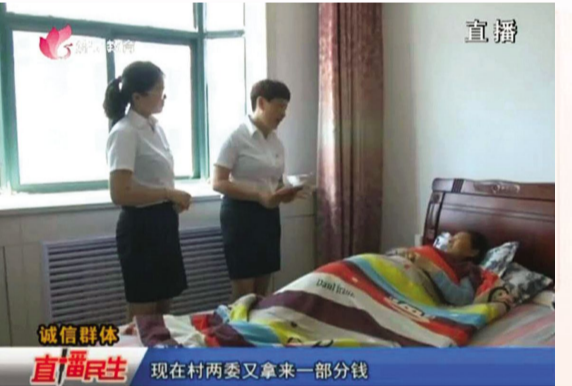
诚信群体 直播民生 现在村两委又拿来一部分钱