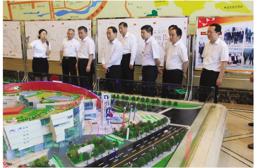
5月16日，省住建厅副厅长周善东带领省委、省政府“一带一路”维稳督导组一行5人来鑫琦国际项目指导工作。