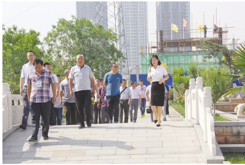
5月19日，任城区安居街道壶头刘村村两委及群众代表45人来我村参观学习新农村建设。