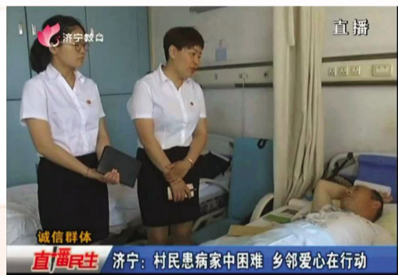
诚信群体 直播民生 济宁：村民患病家中困难 乡邻爱心在行动