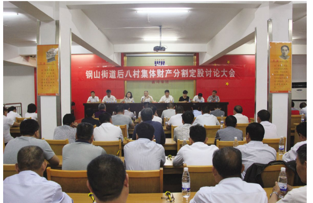
5月22日晚7点，村两委组织全体党员、村民代表、负责人和员工代表召开“集体财产分割定股讨论大会”。