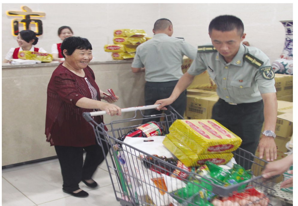
5月29日，中华孝亲第一村后八里村准时给村里老年人发放端午节福利。